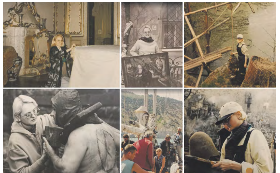
На съемках фильмов «Анна Каренина» (реж. Бернард Роуз), «Трудно быть Богом» (реж. Алексей Герман), сериала «Иванов и Рабинович» (реж. Валерий Быченков)

Беседу вел Артемий Аграфенин